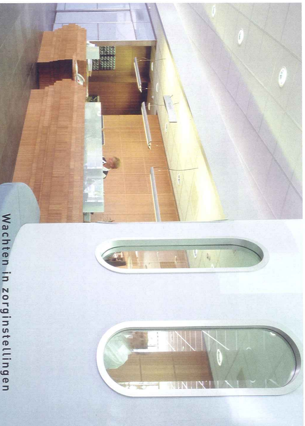
Wachten in zorginstellingen