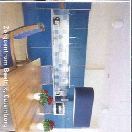
Zorgcentrum Beatrix, Culemborg